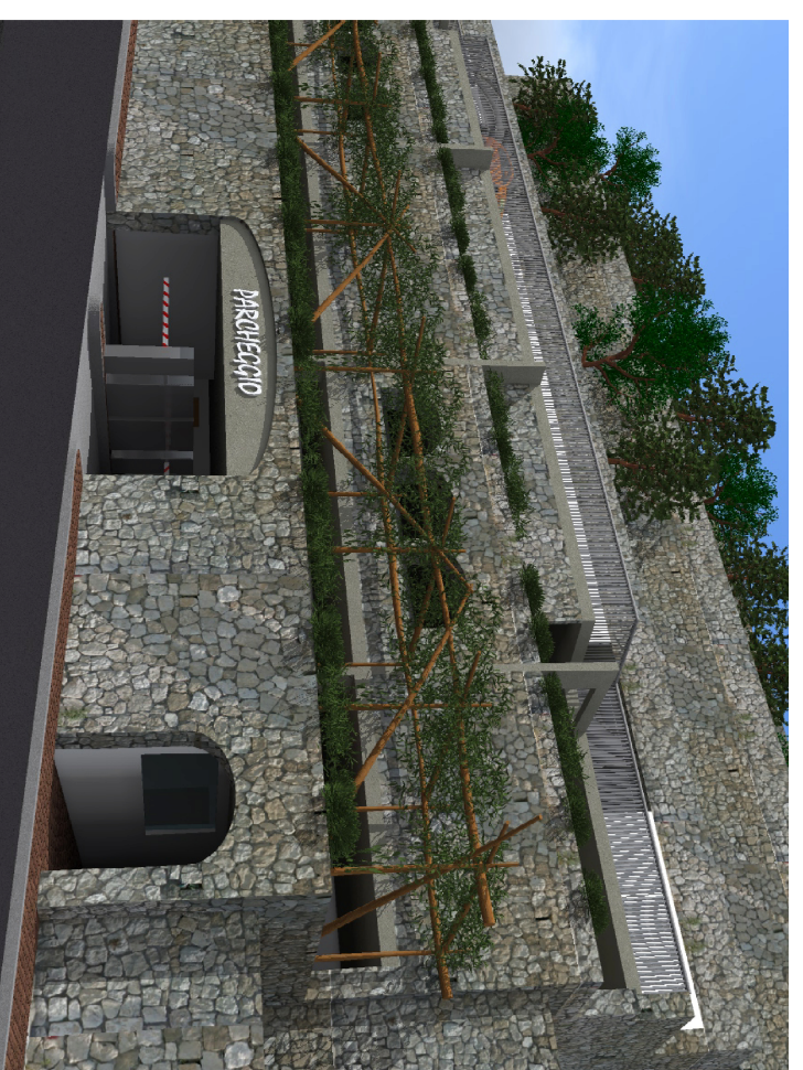
PROGETTO PRELIMINARE (rel. 11/07/2018/2019)

INTERVENTO PER LA REALIZZAZIONE DI UN PARCHETTO SULLA VIA GIULIANO MARCONI CON IMPIANTO DI COLLEGAMENTO MECCANIZATO ALLA STRADA PERIL CARINERO - PROJECT FINANCING EX ART. 155, COMMA 19 DEL D. LGS. N. 50/2016 (GEMAR S.p.A.)