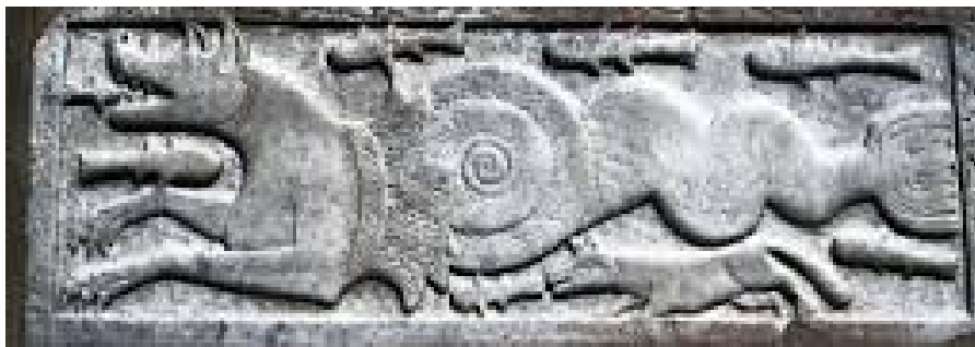
Figura 1 – Pistrice (figura mitologica simbolo di Positano)

Dal punto di vista storico il Comune di Positano (nome che richiama probabilmente la divinità ellenica incarnata dal Dio del mare Poseidone , che fondò la città per amore della ninfa Pasitea) ha condiviso la ricca evoluzione della costiera sorrentino-amalfitana, passando nei secoli attraverso le influenze e le dominazioni greche, italiche, romane etc. fino all'attuale status amministrativo e territoriale, codificatosi nel dopoguerra.